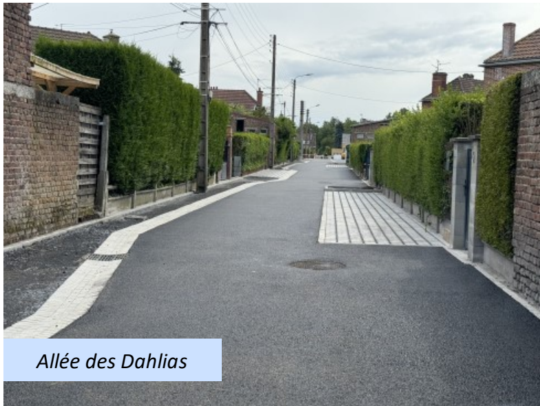
Allée des Dahlias

Ce projet de rénovation ne serait pas complet sans la participation active des résidents de la cité Usinor. Leur implication et leurs avis ont enrichi le processus d'aménagement, garantissant que leurs besoins et leurs attentes ont été pris en compte.