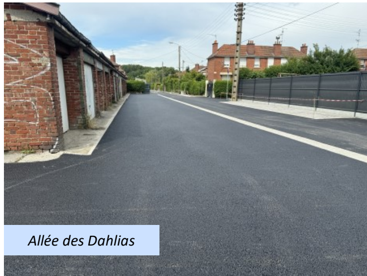
Allée des Dahlias

La première mesure a été de travailler sur la réduction de la vitesse, apportant ainsi un cadre plus sécurisé et apaisé pour les résidents. De plus, des places de parking engazonnées ont été aménagées, apportant une touche de verdure et de fraîcheur au paysage urbain.