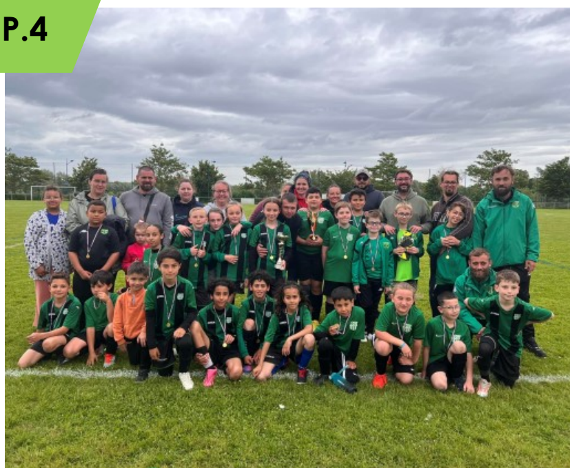
FOOT : DE LA FORMATION À LA PASSION !