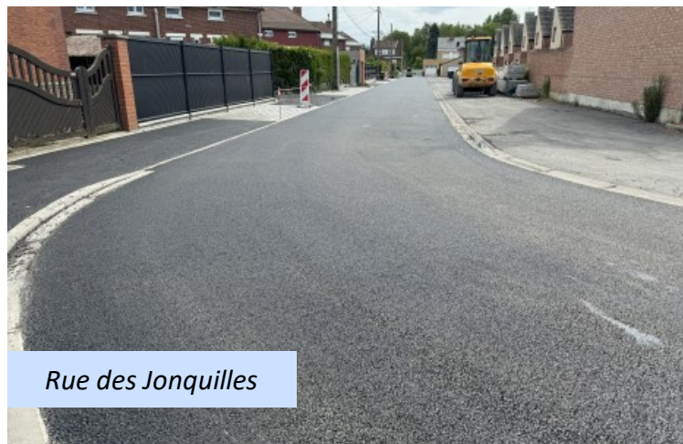
Rue des Jonquilles

Celle-ci marque le début d'une nouvelle étape, où modernité, durabilité et participation citoyenne se conjuguent pour réhabiliter la cité Usinor. Rendez-vous en 2025 pour la phase 2 et la suite des aménagements qui promettent d'embellir encore davantage notre cher quartier. (V.C.)